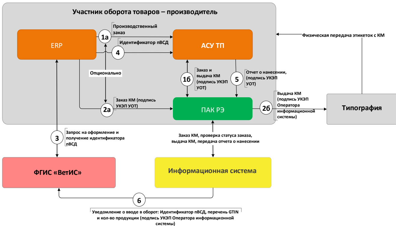
Рисунок 1. Модель взаимодействия. Вариант 1

6. Информационная система формирует отчет о вводе в оборот товаров (отчет включает в себя: идентификатор производственного ВСД; количество КМ, по которым был получена заявка на ввод в оборот, в разрезе GTIN; подписывается УКЭП Оператора информационной системы) и передает его во ФГИС «ВетИС».